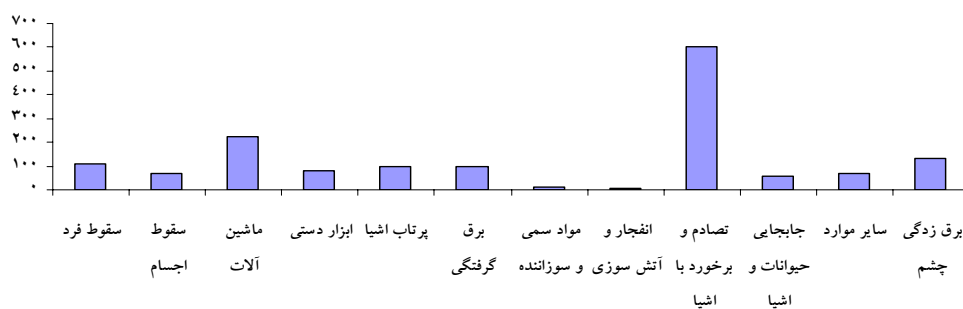
نمودار ۲- توزیع فراوانی آسیب‌دیدگان ناشی از کار بر حسب عامل ایجاد حادثه در شهرستان کاشان طی سال‌های ۱۳۸۴-۱۳۸۵