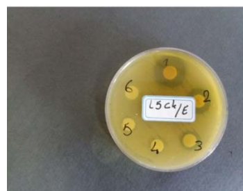
شکل شماره ۲- نمونه‌ای از آزمایش حساسیت میکروبی باکتری Streptococcus mutans تحت تأثیر ترکیبات مختلف به روش نفوذ دیسک در آگار که شماره‌های ۱، ۲، ۳ نشان‌دهنده قطر هاله عدم رشد ترکیبات مورد نظر (عصاره، اسانس و تلفیق عصاره، اسانس و نانوذره نقره) می‌باشد.