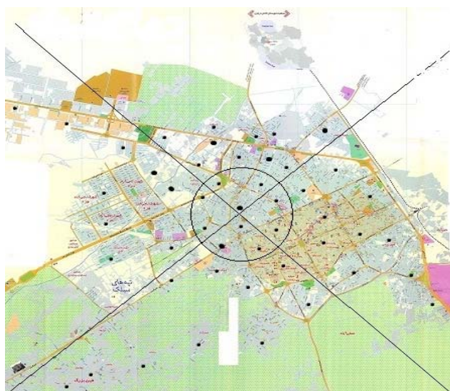
شکل شماره ۱- نقاط انتخاب شده برای اندازه‌گیری تابش گاما در مناطق جغرافیایی پنج‌گانه شهر کاشان (نقاط سیاه)