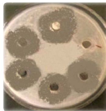
شکل شماره ۴