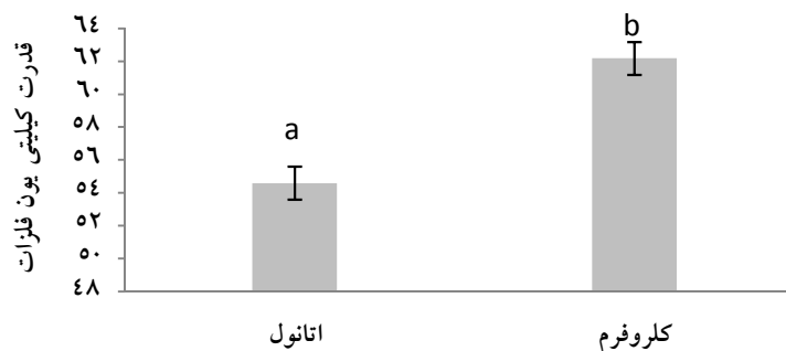
عصاره های جلبک سیستوسیرا ایندیکا

نتایج به شکل انحراف میانگین می‌باشد. حروف a,b,c,d,e اختلاف معنی‌دار در هر ستون و حروف l,m,n,o,p اختلاف معنی‌دار در هر ردیف را نشان می‌دهد. وجود حداقل یک حرف همنام نشان دهنده عدم اختلاف معنی‌دار در سطح احتمال ۹۵ درصد می‌باشد.