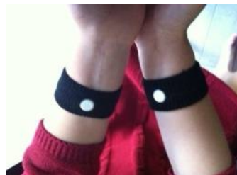
شکل شماره ۲- استفاده از میچ‌بند روی هر دو دست