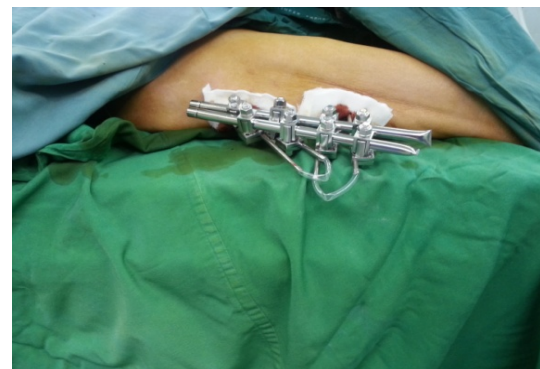
شکل شماره ۴- اکسترنال فیکساتور به خوبی در بیماران پذیرفته شد و هیچ کدام مشکل جدی برای نشستن و یا خوابیدن نداشتند.