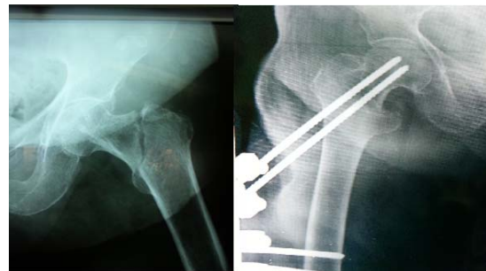
شکل شماره ۳- A گرافی رخ از شکستگی اینترتروکانتریک تایپ AO A1 در بیمار ۸۱ ساله، B. پس از درمان با اکسترنال فیکساسیون در وضعیت مناسب.