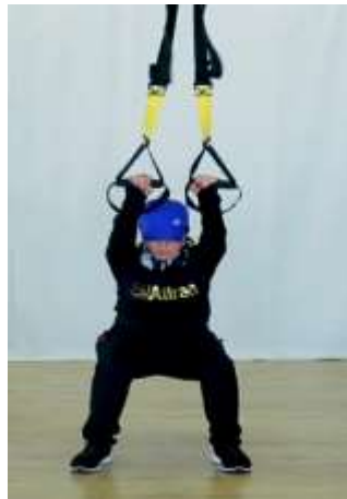
شکل شماره ۱- نمایش دو حرکت با باند های TRX