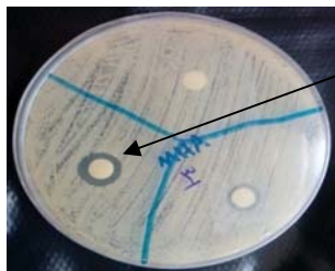
شکل شماره ۲- هاله عدم رشد مخمر کاندیدا در حضور عصاره الکلی جینسینگ ( 64\text{mg}\cdot\text{ml}^{-1} )