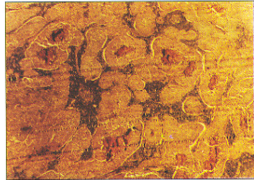
شکل ۱- در بزرگنمایی با عدسی ۲/۵، ضخامت سلولهای تومور با مراکز نکروزه مشهود است

در معاینه لگن زیر بیهوشی توده گل کلمی شکنده که از منشأ دهانه رحم تا دهانه واژن کشیده شده و خود واژن را متسع و تمامی آن را پر کرده بود با اندازه تقریبی 7 \times 12 \text{ cm} قابل لمس بود. از آنجا که بررسی واژن فوقانی و پارامتریوم میسر نبود مقرر شد فردای آنروز بیمار تحت عمل جراحی برداشتن تومور قرار گیرد. رکتوسیگموئیدوسکوپی و سیستوسکوپی نرمال بود. فردای آنروز زیر بیهوشی عمومی بیمار تحت معاینه واژینال مجدد قرار گرفت که طی آن قطعات متعدد تومور در اثر تماس با انگشت جدا و از واژن خارج می‌شد. انسزیون ورتیکال روی شکم داده شد. رحم و تخمدانها طبیعی بود. توموری نسبتا گرد و متقارن از ناحیه ایسم دور تا دور رحم را فرا گرفته بود. کبد، کیسه صفرا، روده‌ها، امتوم، کلیه‌ها و دیافراگم به نظر