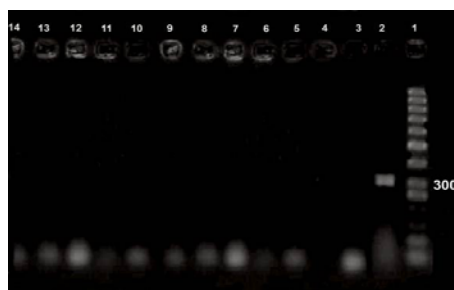
شکل شماره ۲- نتایج PCR سلول‌های بنیادی مزانشیمی مغز استخوان موش‌های صحرائی؛ ستون ۱. مارکر وزن مولکولی DNA Ladder (GeneRuler 50 bp)، ستون ۲. بیان ژن SRY در سلول‌های بنیادی مزانشیمی موش‌های صحرائی نر به عنوان کنترل مثبت، ستون ۳ تا ۱۴: عدم بیان ژن SRY همه گروه‌های پرتو دیده مورد بررسی.