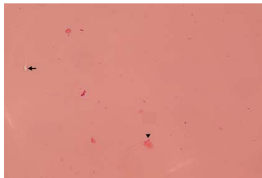
شکل شماره ۱- رنگ آمیزی ائوزین برای ارزیابی قابلیت حیات نمونه‌ها (X ۱۰۰). پیکان: اسپرم‌های زنده پس از انجماد/ ذوب. سر پیکان: اسپرم‌های مرده پس از انجماد/ ذوب.

برای مشاهده تحرک، ۱۰ میکرولیتر از مایع منی بر روی لام شیشه‌ای قرار داده شده و با لامل پوشانده شد. با استفاده از میکروسکوپ نوری و با بزرگنمایی X ۴۰، تعداد اسپرم‌های دارای حرکت سریع پیشرونده و رو به جلو، آهسته پیشرونده رو به جلو، حرکت در جا و اسپرم‌های بی حرکت در چند میدان دید میکروسکوپی شمارش شده و درصد اسپرم‌های متحرک و غیر