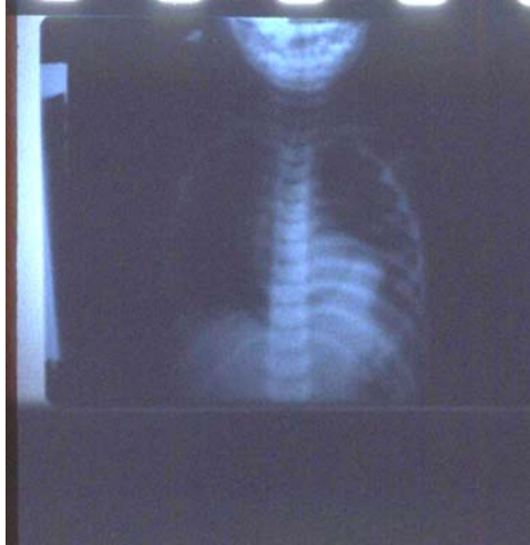
شکل ۱ - تصویر قفسه صدی

از سال ۱۹۶۵ تا کنون ۸۶۷ مقاله در مورد فتق‌های حجاب حاجز در اطفال ارایه شده که ۹ مورد از مقالات به معرفی ۱۷ بیمار مبتلا به فتق حجاب حاجز که منجر به ولولوس (پیچ خوردگی) معده شده‌اند پرداخته و موردی از فتق مورگانی طرف چپ همراه انسداد حاد معده گزارش نشده [۸]. با عنایت به این مطلب که شیرخوار معرفی شده دچار عارضه فتق مورگانی یعنی پیچ خوردگی معده و استفراغ همراه با خونریزی از معده بر اثر پیچ خوردگی شده بود، لذا علائم بالینی شیرخوار گمراه کننده بود، به طوری که تصویر قفسه صدی بالینی غیرمعمول و مشاهدات پاراکلینیک گمراه کننده و این مطلب که فتق مورگانی در طرف چپ بسیار نادر است [۷] و ما شاهد یک مورد مراجعه کننده به بیمارستان شهید بهشتی کاشان در سال ۱۳۸۲ بوده، که به معرفی آن اقدام نموده تا نتیجه‌ای برای چگونگی تشخیص و تصمیم گیری در این بیماری در موارد مشابه باشد.