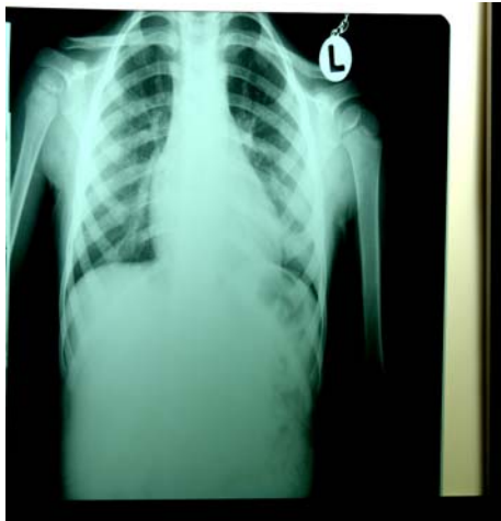
شکل ۴- تصویر قفسه صدری

نداشت. ABG، هر ۶ ساعت انجام شده و روز سوم پس از عمل لوله قفسه سینه خارج شد. در روز چهارم لوله معده خارج و تغذیه با مایعات شروع و روز ۷ پس از عمل بیمار با حال عمومی خوب و کنترل تصویر ریه مرخص شد. در پیگیری، بیمار مشکل خاصی نداشت و علائمی از عود و رفلکس وجود نداشت. بیمار هر ماه ویزیت گردیده و تا تاریخ ۸۴/۹/۱۰ یعنی حدود ۲ سال پس از عمل جراحی کنترل عملکرد قفسه سینه پیگیری گردید که هیچ گونه مشکلی نداشت. شکل شماره ۴ تصویر قفسه صدری بیمار در آخرین مراجعه را نشان می‌دهد.