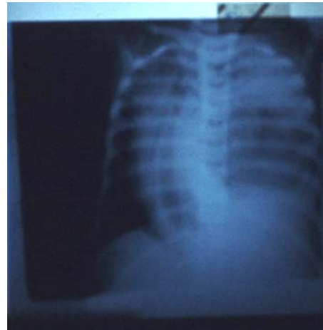
شکل ۳- تصویر ساده قفسه صدری با شیفیت مדיاستن

با توجه به این تصویر که تشخیص پیچ خوردگی معده و فتق حجاب حاجز را مطرح می‌کرد شیرخوار به سرویس جراحی منتقل شد.