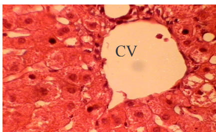
شکل ۳- مقطع میکروسکوپی از بافت کبد خرگوش گروه دریافت کننده کلسترول. رنگ آمیزی هماتوکسیلین اتوزین با بزرگنمایی ۴۰۰×. پیکان محل رسوب کلسترول را نشان می‌دهد. CV: ورید مرکز لبولی.