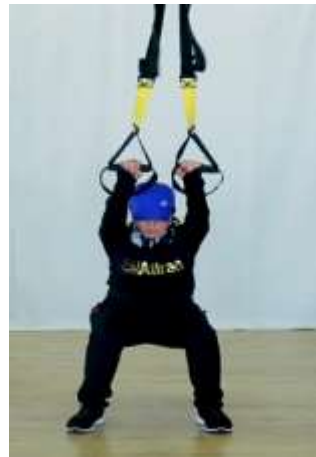
شکل شماره ۱- نمایش دو حرکت با باندهای TRX