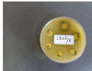
شکل شماره ۲- نمونه‌ای از آزمایش حساسیت میکروبی باکتری Streptococcus mutans تحت تأثیر ترکیبات مختلف به روش نفوذ دیسک در آگار که شماره‌های ۱، ۲، ۳ نشان‌دهنده قطر هاله عدم رشد ترکیبات مورد نظر (عصاره، اسانس و تلفیق عصاره، اسانس و نانوذره نقره) می‌باشد.