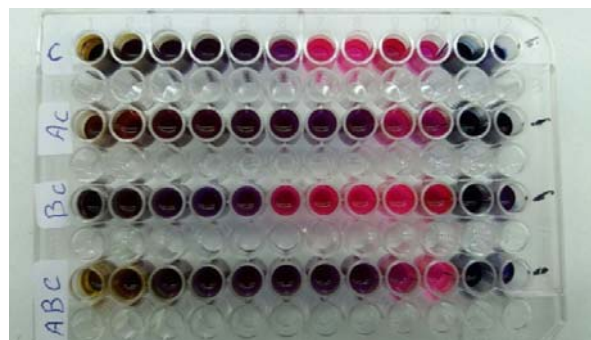
شکل شماره ۱- نمونه ای از آزمایش تعیین MIC ترکیبات مورد نظر در تحقیق حاضر با استفاده از معرف رنگی ترازولیوم.

مطابق جدول شماره ۱ و شکل شماره ۲ مشخص شد که بیشترین قطر منطقه عدم رشد باکتری استرپتوکوکوس موتانس در آزمایش آنتی بیوگرام به روش نفوذ دیسک در آگار مربوط به تلفیق عصاره و اسانس گیاه اکالیپتوس میکروتکا و نانوذره نقره و به میزان 23 \pm 0/3 میلی متر و کمترین مقدار آن هم به میزان 7 \pm 0/1 میلی متر مربوط به تلفیق عصاره گیاه مذکور و نانوذره نقره می باشد. همچنین براساس نتایج جدول شماره ۲ و شکل شماره ۳ مشخص شد که باکتری مورد آزمایش در تحقیق حاضر نسبت به آنتی-بیوتیک های آموکسی سیلین- کلارولانیک اسید و سیپروفلوکساسین مقاوم و نسبت به آنتی بیوتیک کلرامفنیکل حساس می باشد. از طرف دیگر با توجه به نتایج به دست آمده از آزمایشات سنجش حساسیت میکروبی به روش نفوذ دیسک در آگار و آنالیز آماری آن ها مطابق شکل شماره ۴ مشخص شد که از نظر خاصیت ضد استرپتوکوکوی بین عصاره و اسانس گیاه مورد آزمایش که دارای میانگین و انحراف معیار ( 42/33 \pm 2/033 ) است و نیز بین عصاره و تلفیق عصاره و اسانس و نانوذره نقره اختلاف آماری معنی داری وجود ندارد ( 45/33 \pm 1/882 ) در حالی که از این نظر بین اثرات عصاره و نانوذره نقره ( 35/66 \pm 1/764 ) و همچنین عصاره و تلفیق عصاره و نانوذره ( 29/66 \pm 1/215 ) و همچنین