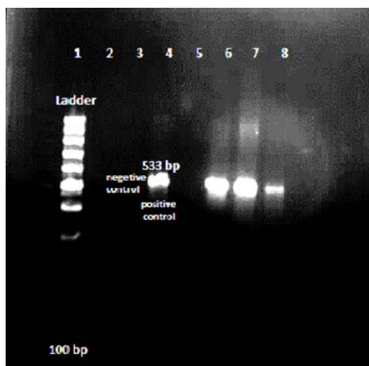
شکل شماره ۱- تصویر ژل از محصول PCR ژن mecA با اندازه ۵۳۳ جفت باز چاهک ۱: مارکر وزن مولکولی، چاهک ۲: کنترل منفی، چاهک ۳: کنترل مثبت، چاهک ۴-۸: نمونه‌های مثبت