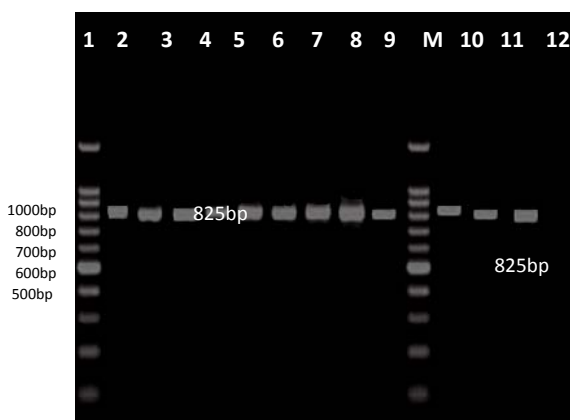
شکل شماره ۲- الکتروفورز ژل ۱ درصد محصول PCR ناحیه ژنومی ND1 ایزوله‌های شتر و سگ منطقه اصفهان، (۱-۹) باندهای 825bp ایزوله شتر (۱۰-۱۲) باندهای 825bp ایزوله سگ، M مارکر وزنی 100bp و N کنترل منفی

سیس، ۴ میکرولیتر از محصول PCR تهیه شده به همراه ۲ میکرو-لیتر بافر loading در کنار مارکر وزنی DNA 100bp، کنترل منفی (آب مقطر دوبار تقطیر) و کنترل مثبت (محصول PCR حاوی DNA استاندارد شده انگل) در ژل آگاروز ۱ درصد بارگذاری شده و در ولتاژ ۸۰ به مدت ۴۵ دقیقه الکتروفورز انجام شد. و با استفاده از ترانس‌لومیناتور باندهای تشکیل شده آنالیز گردید. مشاهده باندهای تقریبی 550bp و 820bp به ترتیب نشان-دهنده وجود ژن CO1 و ND1 در ایزوله‌های مورد مطالعه بود. همچنین، برای ۷ نمونه محصول PCR ایزوله‌های شتر و ۵ نمونه محصول PCR ایزوله‌های سگ تعیین توالی صورت گرفت. به منظور تعیین میزان مشابهت ژنتیکی بین سکانس‌ها و در مقایسه با موارد ثبت شده در بانک ژن، توالی‌ها با استفاده از نرم‌افزار ClustalW2 مورد آنالیز دوبه‌دو قرار گرفت.