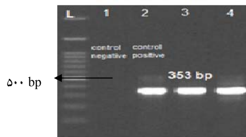
شکل شماره ۱- نتایج PCR ژن blaOXA51 سویه‌های اسیتو-باکتر بومانی جدا شده از نمونه لوله تراشه بیماران بستری در بیمارستان شهید بهشتی کاشان

سال ۱۳۸۶ روی نمونه‌های اسیتوباکتر جدا شده از بیماران بستری در بیمارستان شهید بهشتی کاشان ایزوله‌های MDR ۱۵ درصد گزارش گردید [۱۸] که با نتایج این تحقیق مطابقت نداشت. این افزایش قابل توجه ممکن است ناشی از تفاوت در نمونه‌های بالینی مورد بررسی، زمان انجام مطالعه، تنوع در الگوی مصرف آنتی بیوتیک‌های مصرفی و عدم به کارگیری ابزارهای مناسب کنترل عفونت بیمارستان در سال‌های اخیر بوده که منجر به ظهور و انتشار باکتری‌های MDR در بخش مراقبت‌های ویژه بیمارستان شده است. در این مطالعه بیشترین مقاومت به سفالوسپورین‌ها، کینولون‌ها و کارباپنم‌ها مشاهده شد. با توجه به اینکه کارباپنم‌ها داروهای انتخابی جهت درمان بیماران آلوده به ایزوله‌های اسیتو-باکتر بومانی با مقاومت دارویی چندگانه هستند، لذا آمار بالای مقاومت نسبت به این داروها نگران کننده بوده و نشان از محدود شدن گزینه‌های درمانی است [۱۶]. در مطالعه کاشان در سال ۸۶ مقاومت به ایمپنم ۲۵ درصد گزارش شده [۱۸] و در مطالعه حاضر مقاومت به ایمپنم ۱۰۰ درصد بود. از آنجایی که تمامی بیماران مورد مطالعه سابقه تجویز مصرف داروهای کارباپنم را داشتند، یکی از دلایل افزایش مقاومت می‌تواند مصرف بی رویه این آنتی بیوتیک بدون توجه به نتایج آنتی بیوگرام در بیماران آلوده به اسیتوباکتر باشد. سایر محققین در ایران مقاومت کارباپنم را از