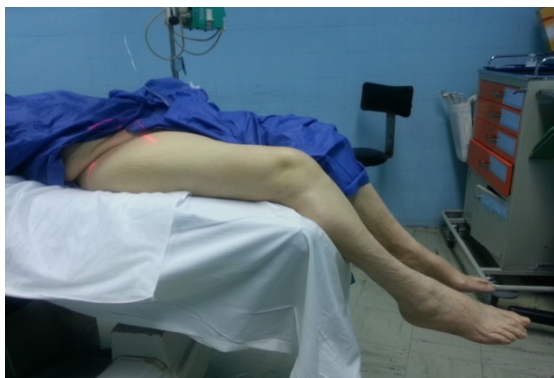
شکل شماره ۱- وضعیت بیماران برای ریداکشن شکستگی قبل از گذاشتن اکسترنال فیکساتور