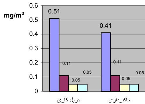
■ Free Silica Emarat ■ Free Silica Iran ■ Free Silica ACGIH ■ Free Silica NIOSH

نمودار ۲- میانگین غلظت سیلیس آزاد گرد و غبار کل در منطقه تنفسی کارگران قسمت های مختلف معدن روباز و مقایسه آن با مقادیر استانداردهای ایران،