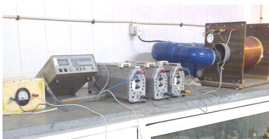
تصویر شماره ۱- سیستم مولد میدان الکترومغناطیس و انکوباسیون (A) سیم پیچ مولد میدان الکترومغناطیس، (B) سیستم انکوباسیون، (C) رثوستا، (D) ولت سنج، (E) خازن

۱۰ درصد سرم جنین گاوی FBS در فلاسک‌های ۵۰ cc کشت سلولی با درب فیلتردار استریل (ساخت شرکت JET BIOFIL کانادا) که حاوی ۵ میلی‌لیتر محیط بودند، کشت داده شدند و در هر فلاسک 5 \times 10^5 سلول ریخته شد. سلول‌ها در انکوباتور ۳۷ درجه سانتی‌گراد، رطوبت ۹۰ درصد و دی‌اکسید کربن ۵ درصد قرار داده شدند [۲۱]. برای تأمین میدان الکترومغناطیس از یک سیستم ویژه که دارای شرایط مناسب انکوباسیون (دمای ۳۷ درجه سانتی‌گراد، رطوبت ۹۰ درصد) می‌باشد، استفاده شد (طراحی و ساخت با کمک و همکاری گروه زیست‌شناسی و گروه فیزیک دانشگاه آزاد اسلامی واحد مشهد). این سیستم از یک سیم‌پیچ مسی که توسط جریان برق متناوب شهری تغذیه می‌شود، تشکیل شده است. در مسیر جریان برق شهری با فرکانس ۵۰ هرتز و ولتاژ ۲۲۰ ولت، سه رثوستا قرار دارد که شدت جریان برق ورودی به سیم‌پیچ توسط آن‌ها تنظیم می‌گردد. این سیم‌پیچ قادر به تأمین شدت میدان الکترومغناطیس بین ۱۰ تا ۴۰۰ گاوس می‌باشد. (تصویر شماره ۱). ۲۴ ساعت بعد از زمان کشت، سلول‌ها به مدت ۳ ساعت در مجاورت میدان الکترومغناطیس با فرکانس ۵۰ هرتز و شدت‌های ۵۰، ۲۰۰ و ۴۰۰ گاوس قرار گرفتند و تغییرات مورفولوژیک ایجاد شده توسط میکروسکوپ معکوس، عکس برداری شد. سلول‌ها در حالت طبیعی دارای مورفولوژی ستاره‌ای شکل می‌باشند. تحلیل رفتگی (کوچک‌شدگی) و افزایش اندازه واکوئل، کاهش سیتوپلاسم و پیگمانته شدن هسته، نشانه‌ای از تغییرات مورفولوژیک و در نتیجه نشانه‌ای از مرگ سلول‌ها می‌باشد. این دو تغییر یعنی تحلیل رفتگی و پیگمانته شدن هسته از نشانه‌های مرگ برنامه‌ریزی شده سلول (آپوپتوزیس) می‌باشد [۲۲].