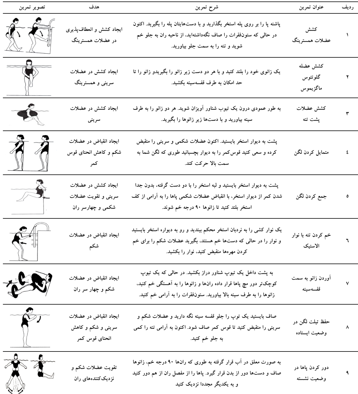
جدول شماره ۱- تمرینات اصلی گروه تجربی آب درمانی