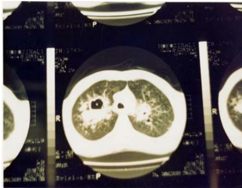
شکل ۳- سی‌تی‌اسکن ریه راست، آبسه همراه با سطح هوا - مایع را نشان می‌دهد.

در هر دو ریه نواحی پراکنده تجامد نیز جلب توجه می‌کرد. سی‌تی‌اسکن از ریه‌ها، پنوماتوسل در هر دو ریه همراه با آبسه در لوب فوقانی ریه راست را گزارش نمود (شکل‌های ۲ و ۳).