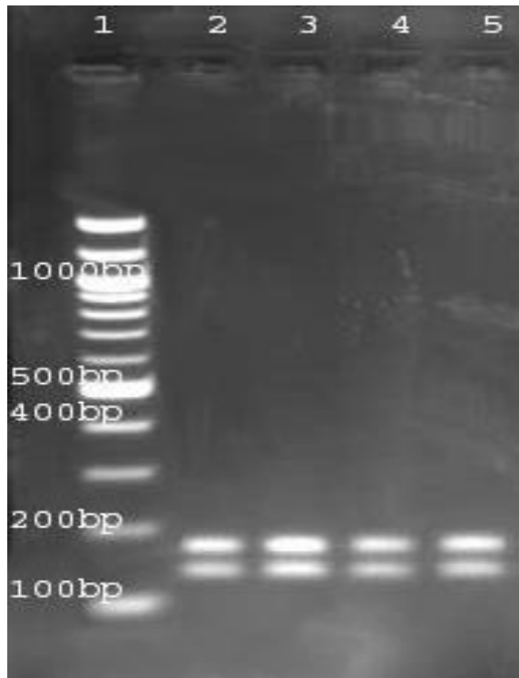
تصویر شماره ۲- الگوی محصولات PCR-RFLP قطعه rDNA-ITS2 ایزوله‌های تخم تریکوسترنزیلوس برش داده شده با آنزیم RsaI ، شماره ۱ شناساگر مولکولی، شماره ۲ Tricostrongylus axei ، شماره ۳ T. viterinus ، شماره ۴ T. colubriformis ، شماره ۵ T. probolurus

محصول PCR تخم تریکوسترنزیلوسها با آنزیم HinfI مشاهده شد (شکل شماره ۳)