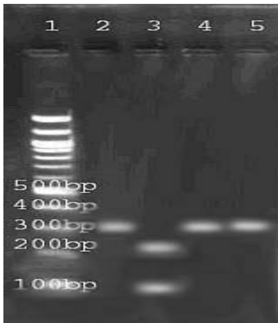
تصویر شماره ۳- الگوی محصولات PCR-RFLP قطعه rDNA-ITS2 ایزوله‌های تخم تریکوسترنزیلوس برش داده شده با آنزیم HinfI ، شماره ۱ شناساگر مولکولی، شماره ۲ T. probolurus ، شماره ۳ T. colubriformis ، شماره ۴ T. axei ، شماره ۵ T. viterinus

محصول PCR تخم تریکوسترنزیلوسها با آنزیم HinfI مشاهده شد و تنها در محصول PCR تریکوسترنزیلوس