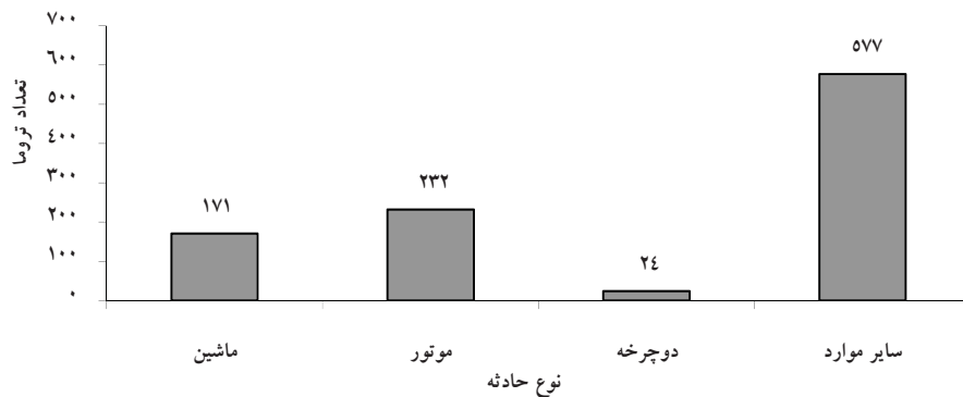
نمودار شماره ۳- توزیع درصد فراوانی ترومای منجر به مجروحیت برحسب نوع تصادف