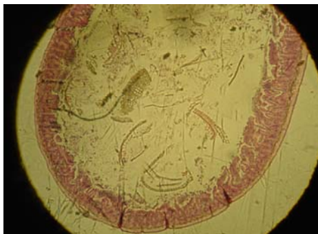
شکل ۱- مقطع عرضی روده کوچک در گروه سوختگی. کوچک شدن مخاط روده کاملا مشخص است

* در مقایسه با گروه کنترل و گروه سوختگی + ال آرژنین