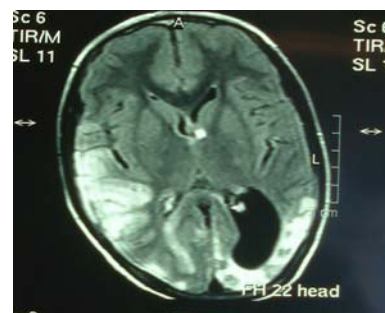
شکل شماره ۲- افزایش شدت سیگنال در ناحیه قاعده‌ای و کورتیکال در دو قشر پس سری با ارجحیت در سمت راست در این نمای MRI دیده می‌شود.

همچنین در گزارش MRI ثبت شده از مغز بیمار افزایش شدت سیگنال در ناحیه قاعده‌ای و کورتیکال هر دو قشر پس سری با ارجحیت در سمت راست ذکر شده بود (تصویر شماره ۲). با توجه به شرح حال برای نام برده احتمال وجود ضایعات عروق مغزی مطرح شد، ولی بررسی عروق مغزی Brain MRA و Brain MRV طبیعی گزارش شد.