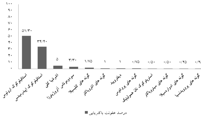
نمودار شماره ۱- عوامل باکتریایی شناسایی شده در بیماران مبتلا به عفونت های پوست و بافت نرم مراجعه کننده به بیمارستان رازی تهران طی سال های ۹۴-۱۳۹۳

به سایر عوامل باکتریایی مبتلا به عفونت پوست و بافت نرم ناشی از استافیلوکوکوس اورئوس بودند.