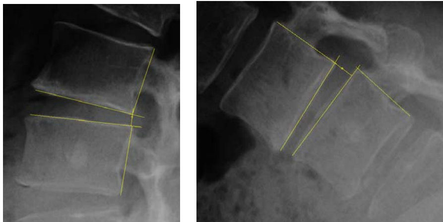
شکل شماره ۱- جابه‌جایی در اکستنشن = 0/42 میلی‌متر و جابه‌جایی در فلکشن = 4/04 میلی‌متر، بنابراین مقدار حرکت در صفحه ساجیتال یا همان ناپایداری حرکتی ساجیتال برابر است با 3/62 میلی‌متر.

در این مطالعه مقطعی تمام بیمارانی که به‌دلیل کمردرد به کلینیک ستون فقرات بیمارستان باهنر شهر کرمان مراجعه کرده بودند و حداقل یک ماه درمان برای آنها ناموفق بوده، وارد شدند. به‌منظور تشخیص و ادامه درمان برای آنها ام‌آر‌آی و رادیوگرافی ایستاده ستون فقرات در حالت روبه‌رو و رادیوگرافی نیم‌رخ در حالت فلکشن و اکستنشن درخواست شد. معیارهای خروج از مطالعه عبارت بودند از: ۱- ابتلا به بیماری‌های ستون فقرات ناشی از تروما؛ ۲- ابتلا به بیماری‌های التهابی ستون فقرات؛ ۳- ابتلا به تومورهای ستون فقرات؛ ۴- داشتن هرگونه سابقه جراحی در ستون فقرات؛ ۵- موارد اسپوندیلولیتیزیس‌های ایستمیک و تروماتیک؛ و ۶- وجود مهره‌های ترنزیشنال. برای تعیین شدت دژنراسیون از