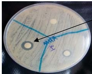
شکل شماره ۲- هاله عدم رشد مخمر کاندیدا در حضور عصاره الکلی جینسینگ ( 64\text{mg}\cdot\text{ml}^{-1} )